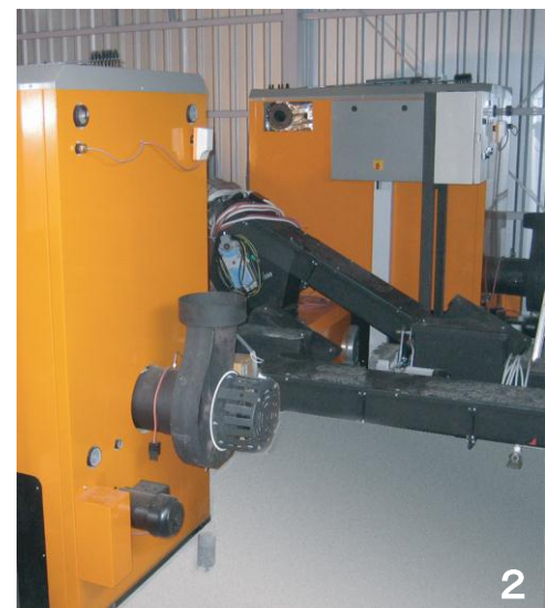
1. ペレット用サイロ 2. 2基のペレットボイラ